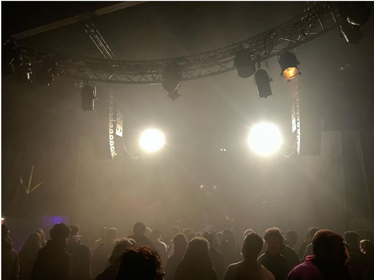
Nice Rave

Die programmatorische und budgetäre Entscheidung, dass sich die Grosse Halle nicht mit Grossanlässen querfinanzieren kann und muss, erweist sich nach wie vor als richtig. Grossveranstaltungen beziehungsweise Veranstaltungen im Bereich Konzerte und Partys blieben 2023 schwer zu planen. Es kommen weniger Besuchende als vor der Corona-Zeit und die Vorverkäufe laufen weniger gut. Auch die Bar-Umsätze sind weniger hoch. Als Mitveranstalterin passen wir unsere Mieten an die finanziellen Möglichkeiten der Veranstaltenden an. So trägt die Grosse Halle das finanzielle Risiko mit. Dies führt zu grosser Planungsunsicherheit und generell zu weniger Einnahmen für die Grosse Halle.