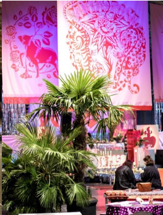
Santa Rosa