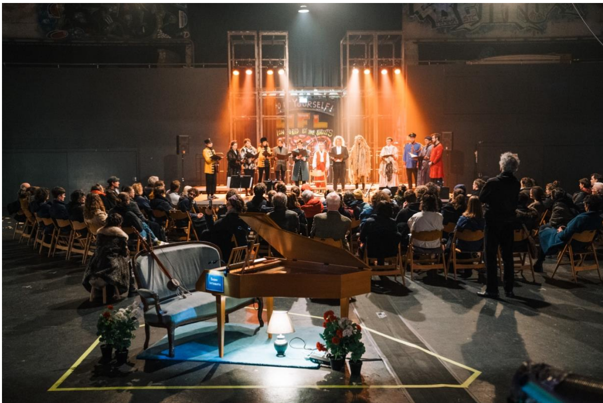
Imaginary Museum of Musical Works II