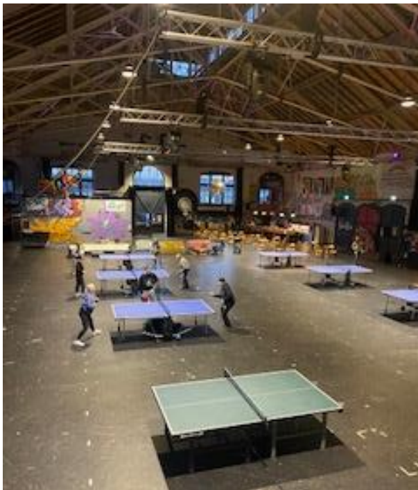
Ping Pong Days, Foto: Team Grosse Halle

Liebe Grüsse aus der Grossen Halle März 2024