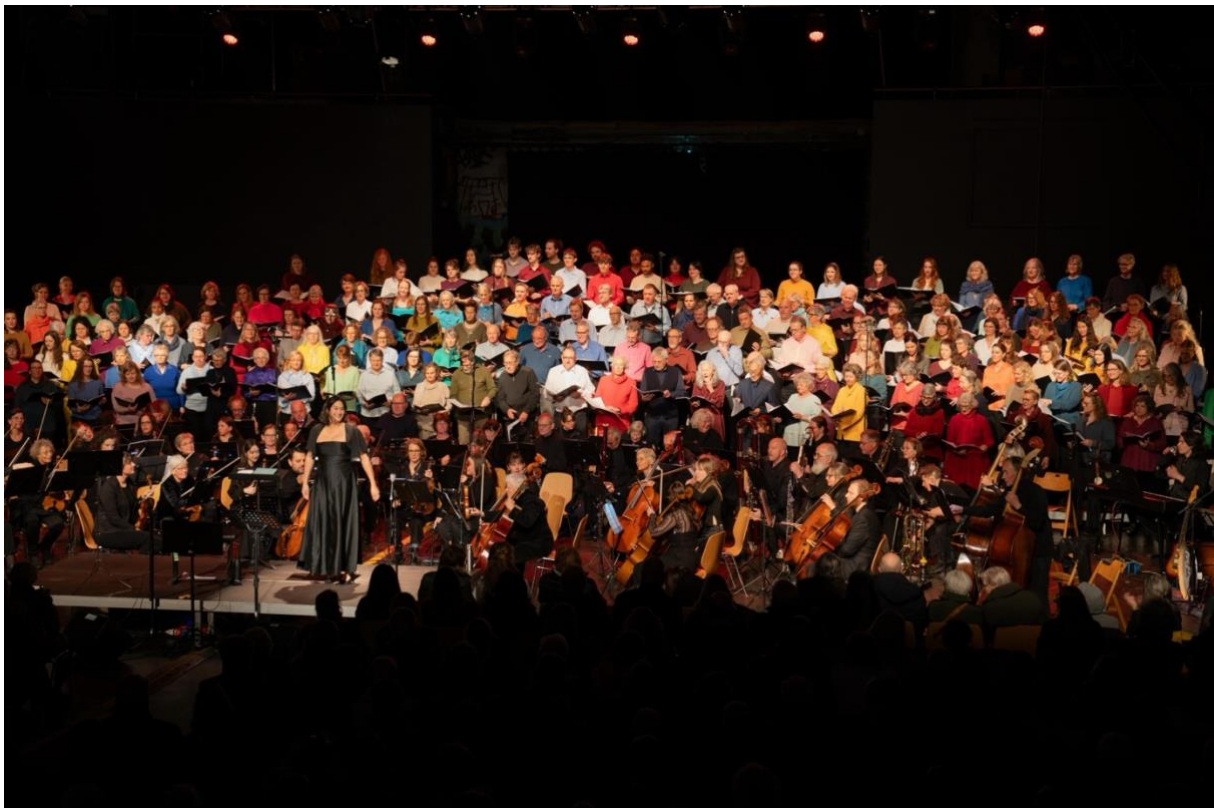
Carmina & more, 14. - 16. März 2025, Foto: Stefan Saladin

Insgesamt fanden in der Grossen Halle Anlässe mit 1'646 Beteiligten und 17'995 Besucher*innen statt (mit dem Flohmarkt 5'918 Beteiligte und rund 50'000 Besuchende).