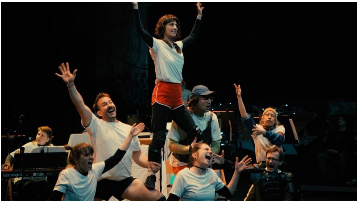
Imaginary Museum of Musical Works, 12. und 13. April 2025

Für die Zukunft müssen wir auch hier in eine sorgfältige Schulung des Personals investieren und Austausch- und Rückmeldungsgefässe schaffen, um das Flohmarkt-Team zu unterstützen, zu schützen und zu ermächtigen.