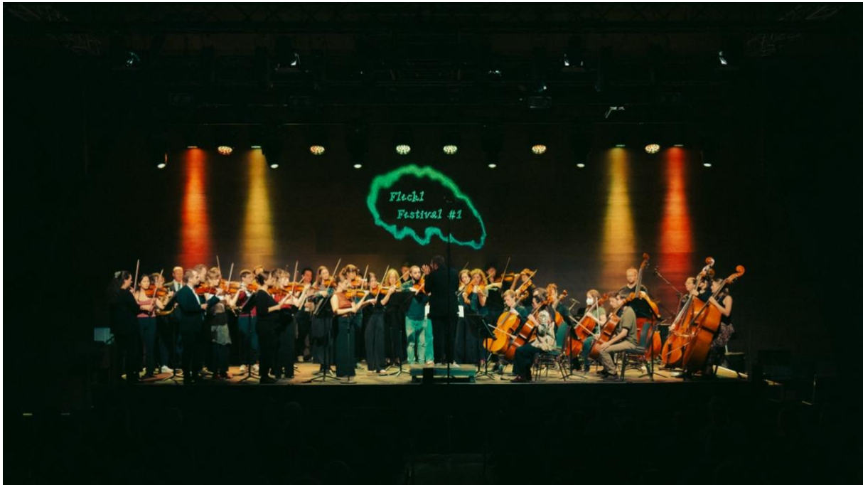
Fleckl Festival, 18. Oktober 2025

Das Gesuch für die Subventionsperiode ab 2029 ist, mit einer Anfrage nach einer weiteren Erhöhung der Subventionen, gestellt.