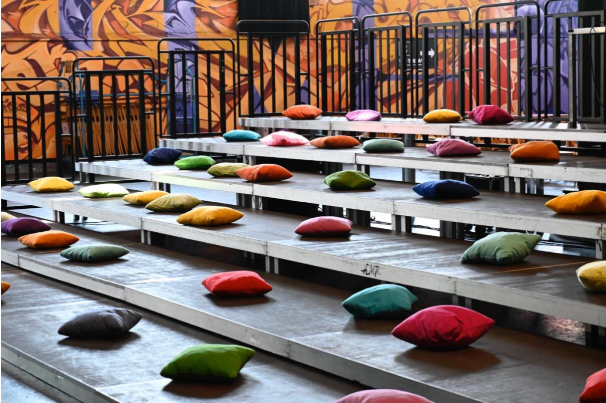
Festival Spiiplätz, 28. Juni 2025, Foto: k.A.