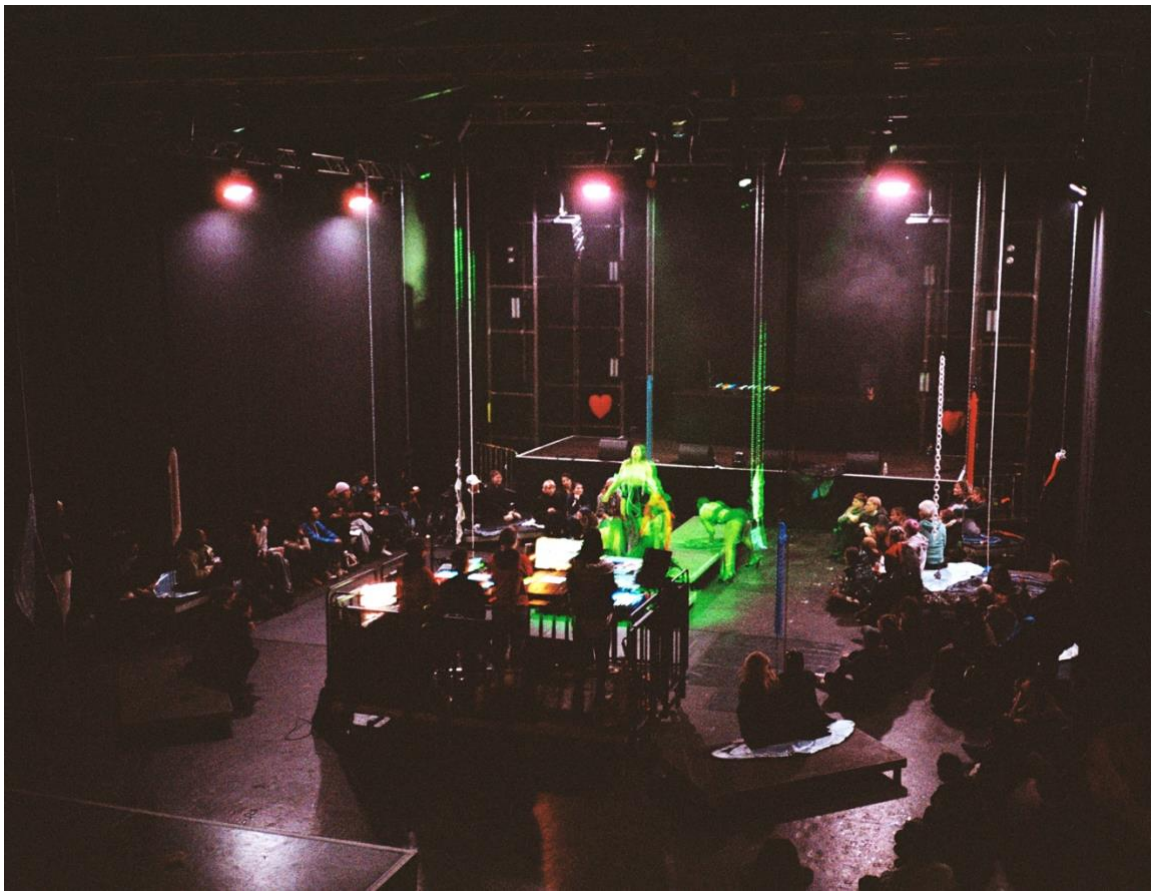
UQFF, 15.11.2025